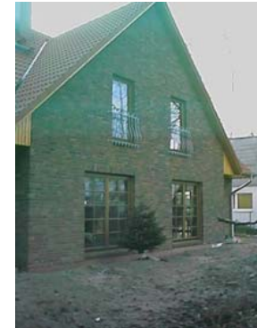
Holzfenster IV 78 mit durchwurfmehrender Verglasung.

... aus Holz, Kunststoff und Aluminium beziehen wir direkt vom Hersteller. Hier bieten wir