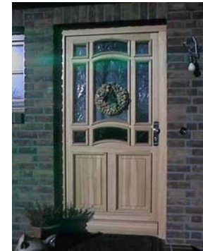
Meisterstück: Hauseingangstür aus massiver Kiefer.

... fertigen wir in unserer Werkstatt auch selber an, wenn es darum geht, Ihre eigenen Wünsche und Vorstellungen zu realisieren. Auch hier können wir Ihnen neben verschiedenen Hölzern,